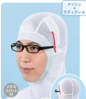
フルフェイス〈クール〉 インナーキャップ RFF520C

素材 / 本体：指定外繊維75%、ポリウレタン25% 上部：ポリエステル95%、ポリウレタン5% サイズ / S、フリー、LL カラー / ホワイト 梱入数 / 10枚×30袋