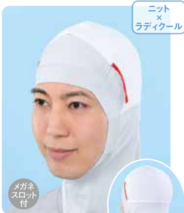
フルフェイス〈クール〉 インナーキャップ RFF420

素材 / 本体：指定外繊維75%、ポリウレタン25% 上部：ポリエステル95%、ポリウレタン5% サイズ / S、フリー、LL カラー / ホワイト 梱入数 / 10枚×30袋