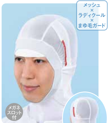
フルフェイス〈クール〉 まゆ毛ガード インナーキャップ RFM520C

素材 / 本体：ポリエステル93%、ポリウレタン7% 顔周り：指定外繊維75%、ポリウレタン25% サイズ / S、フリー、LL カラー / ホワイト 梱入数 / 10枚×30袋