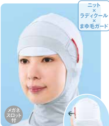
フルフェイス〈クール〉 まゆ毛ガード インナーキャップ RFM420

素材 / 本体：指定外繊維75%、ポリウレタン25% 上部：ポリエステル95%、ポリウレタン5% サイズ / S、フリー、LL カラー / ホワイト 梱入数 / 10枚×30袋